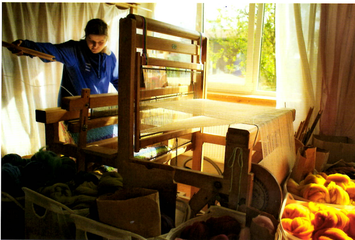
I produkce textilní dílny musí uspět na volném trhu.

ty v sobě mají hodnotu trochu větší, než by ukázal laboratorní rozbor.